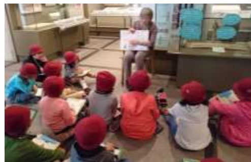
「わがまち すみだの歴史発見！」