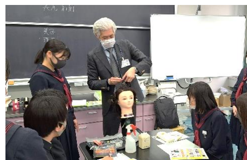
「小・中学生のハローワーク」