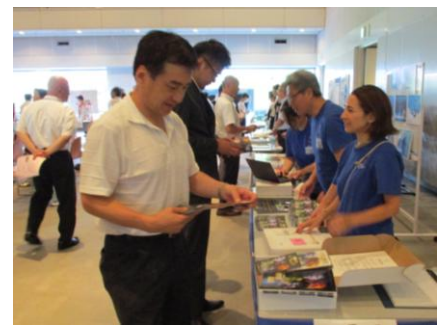
ブース見学の様子