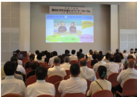
フォーラム発表会場