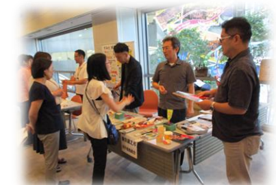
「ブース発表の見学の様子」