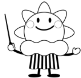
気象庁マスコット キャラクター はれるん

*緊急地震速報や気象庁の発表する情報等をどう活用すればいいのか。 緊急地震速報を取り入れた訓練についても対応可能です。