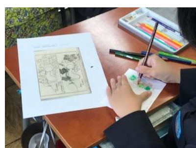
(中)『一筆画譜』 すみだ北斎美術館所蔵