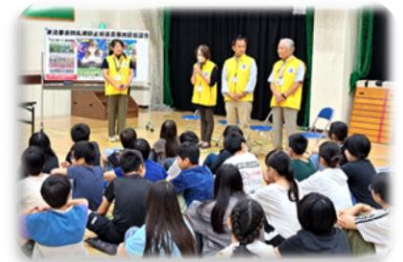
「薬物乱用防止教室-1」