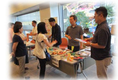
「ブース発表の見学の様子」