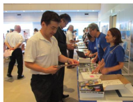
ブース見学の様子