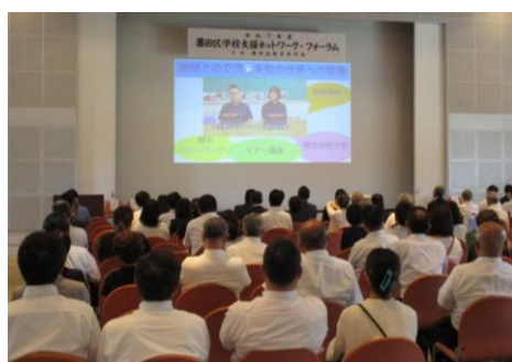
フォーラム発表会場