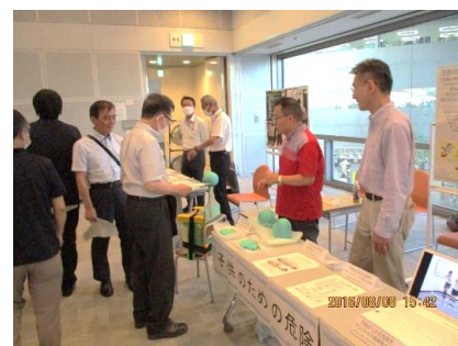
「ブース見学の様子」