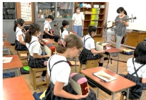
「三味線と日本の文化」

墨田区教育委員会 地域教育支援課 墨田区学校支援ネットワーク本部 一部事業受託者 スカイ学校支援ネットワークセンター TEL 03(5608)1303 FAX 03(5608)6596 E-mail info@demaejyugyouj*